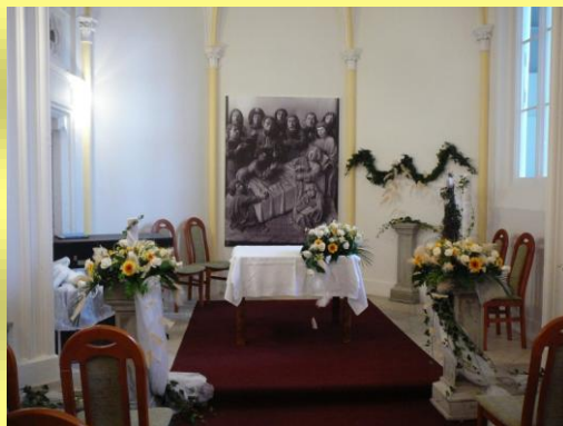
reprezentační prostor pro veřejnost – Zámecká kaple Velké Heraltice